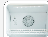
Ventilatore interno di assistenza