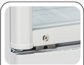
Serratura di serie