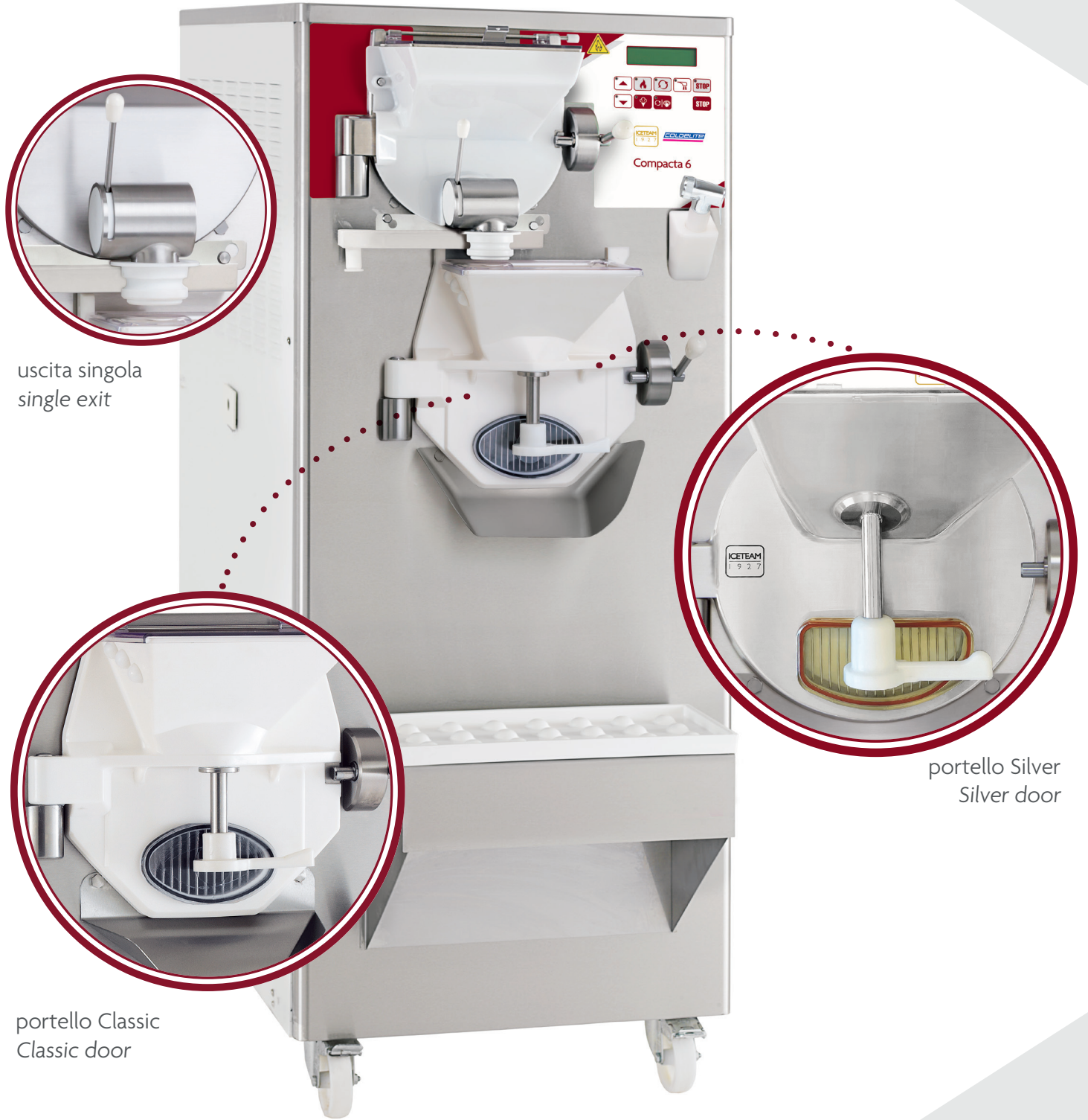
uscita singola single exit